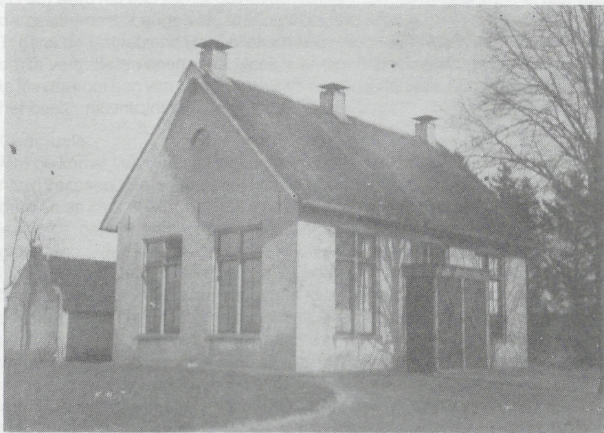
School en meestershuis omstreeks 1900.