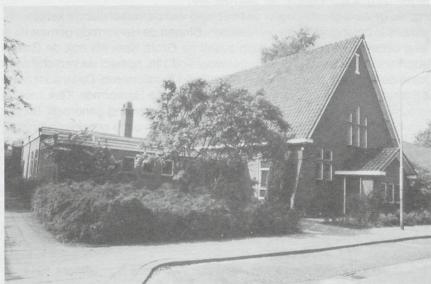
Sionskerk aan de Asseltseweg in de jaren 70.