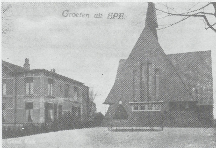
Het kerkgebouw van de Gereformeerde Kerk omstreeks 1950.