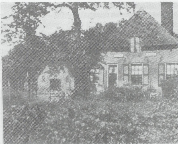
Eppien van de boerderieje (De Willemschoeve).

Ruwe veen ---- 't Is voor de groote kinderen een geluk dat ze in andere omgeving en onder andere leiding komen.-----."