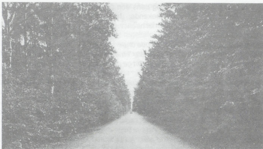
„Den grintweg” ter hoogte van West-Raven.

deze dan per posttrein naar de plaats der bestemming vervoerd werd. En bij deze ontboezeming zal ik het nu laten. Het jaar is nog niet rond, waar ik maar mee zeggen wil: