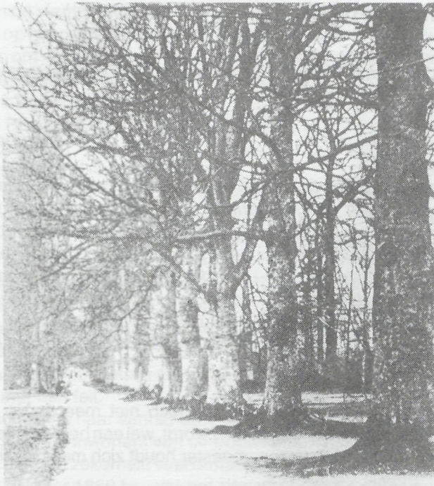
De allee met aan het einde „de Noordkamp”.

In een volgende brief, vertelt meester dat alles vrij goed gaat: