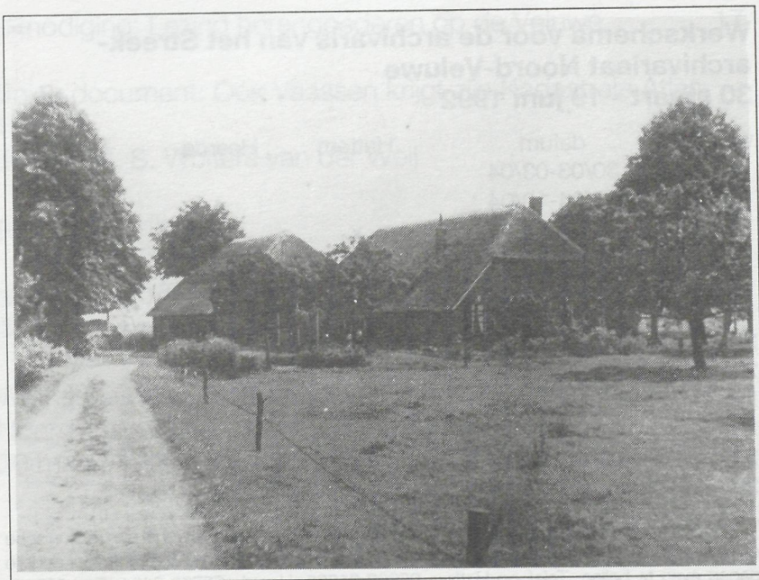
Ganzenebbe tijdens de 2e Wereldoorlog.