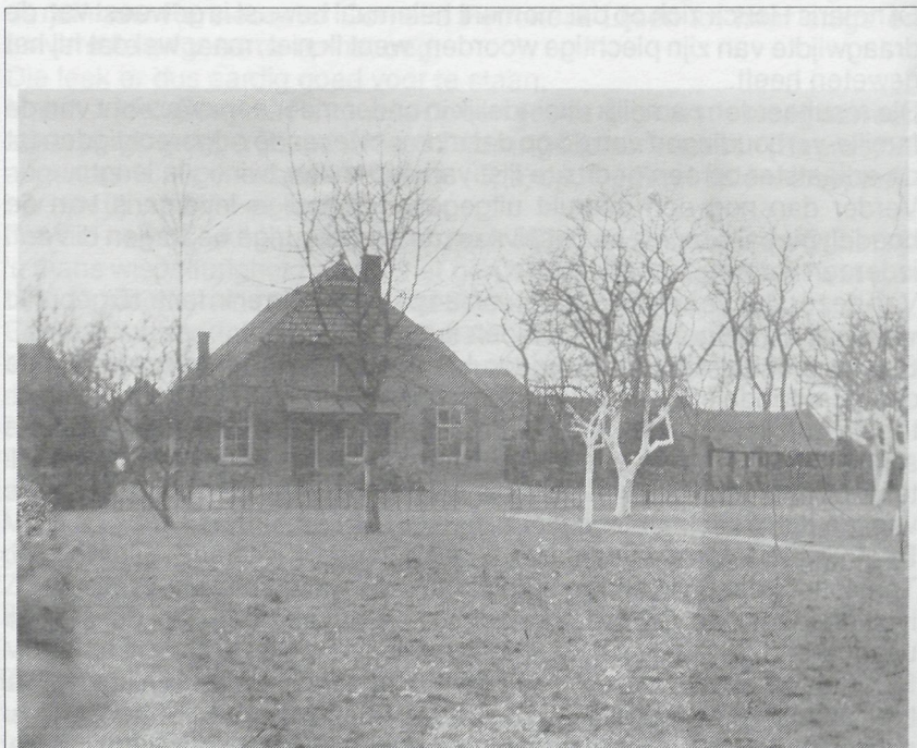
De oude Geelmolen door Berend Zwerus in 1883 aangekocht.