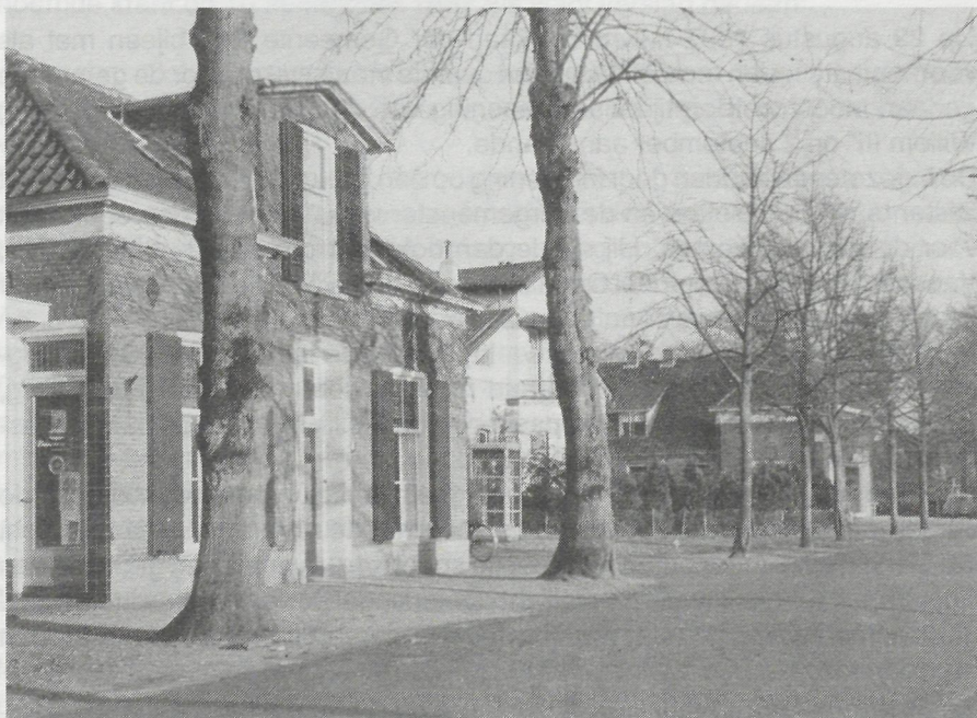
Stationsstraat 13 in 1969.