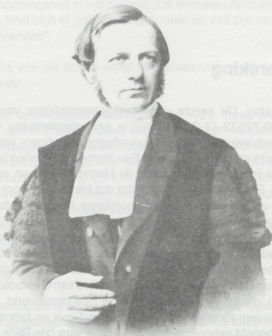
C. H. D. Buys Ballot – 1817-1890.

Het notarieel archief van Vaassen en Epe uit de negentiende en begin twintigste eeuw is een belangrijke informatiebron voor de genealogisch of lokaal-historisch onderzoeker. Men komt er tal van aktensoorten in tegen: verkopen van roerend en onroerend goed, testamenten, boedelinventarissen of hypotheekakten, om er maar een paar te noemen. Meestal was het de plaatselijke bevolking die gebruik maakte van de diensten van de notaris, maar dat was geen vaste regel. Zo gingen de Vaassenaren en Epenaren soms naar de notaris in bijvoorbeeld Apeldoorn. Ook andersom treffen we in het notarieel archief van onze gemeente mensen van buiten aan. Zo kunt u uw voorvaders tegenkomen naast de namen van beroemdheden uit heel Nederland.