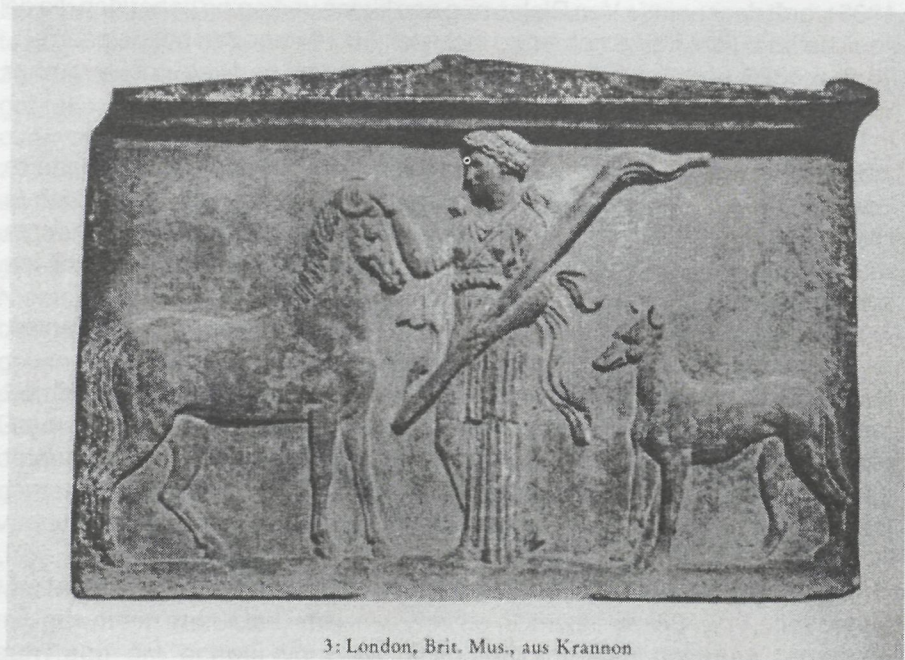
3: London, Brit. Mus., aus Kraannon