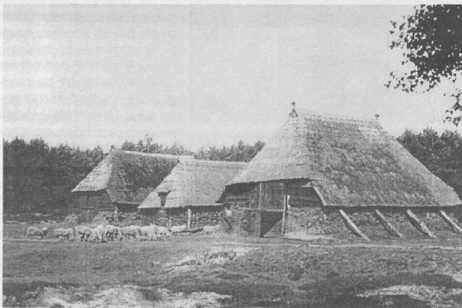
Schaapskooien op Tongeren, 1899.

Naast woeste gronden in particulier bezit waren er de gemeenschappelijke gronden, waar sinds eeuwen de Markegenootschappen bestonden en Domeingronden van de Rijksoverheid. Zou de vonk van de ontginning en landbouwhervorming ook op deze groepen overspringen? Bij de Marken was daar geen sprake van. Daar overheerste de mening dat de heide van groot belang bleef voor het weiden van schapen en het leveren van plaggen voor de potstal. Men wilde daarom ook niet van verdeling der Marken weten. Hoewel de markedeling een apart verhaal is, hangt hij nauw samen met de mogelijkheden voor ontginning.