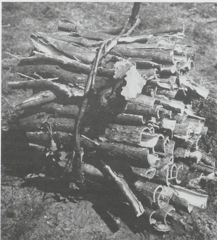
Een bundel schors.

De leder- en schoenenindustrie in de Langstraat en Middenbrabant is daar vroeger ontstaan doordat arme boeren in de wintermaanden huiden en leder bewerkten om het hoofd boven water te houden. Daaruit zijn talrijke leerlooierijen ontstaan, waarvan er nu nog maar één over is.