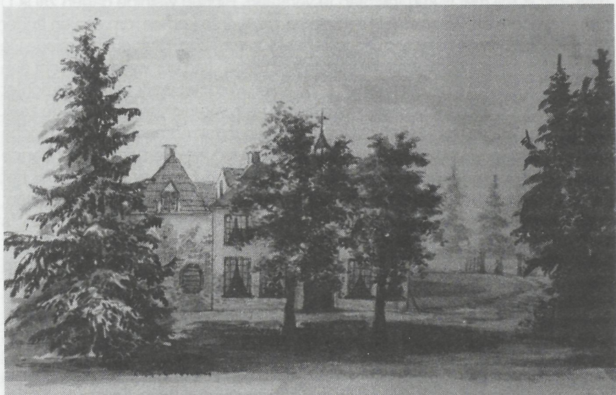
Het Huis Tongeren omstreeks 1830.