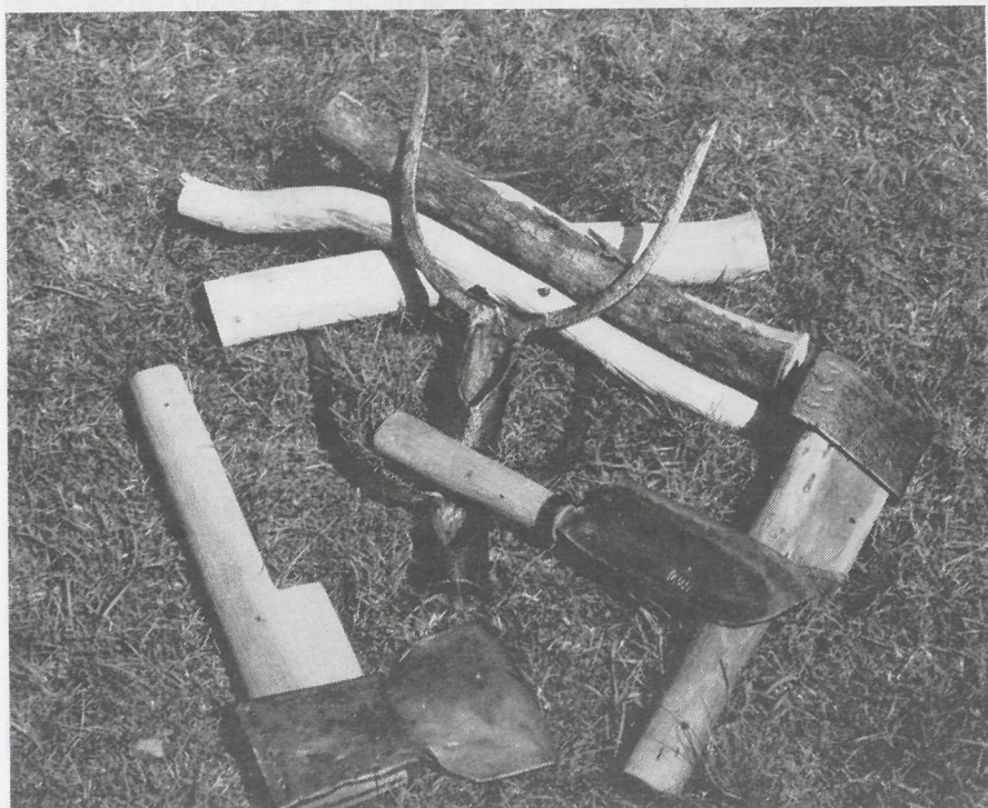
Het gereedschap van de eekschiller

De eekschillers trokken gezamenlijk op, naar Zwolle, waar de boot naar Friesland vertrok. Onderweg werd een paar keer gestopt om te rusten. De geiten aten van het jonge gras langs de bermen.