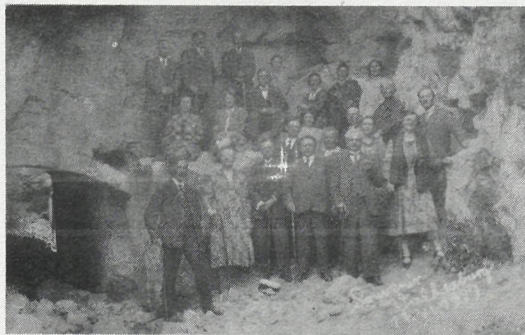
Op deze foto, die in 1929 werd gemaakt vóór de grotten van Valkenburg,

In de twintiger jaren bestond er in Epe een reisclub waarvan de leden tot verschillende sociale, godsdienstige en politieke milieu's behoorden. Wekelijks werd een bepaalde contributie betaald. Was er genoeg geld in kas, dan maakte men één- of tweemaal per jaar een jagtocht per trein of bus.