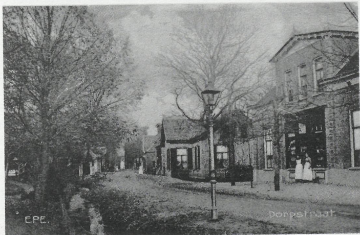
Foto van de Hoofdstraat van Epe in 1910 links de Dorpsbeek

In de jaren vijftig is de Dorpsbeek minder water gaan afvoeren, wat o.a. veroorzaakt wordt doordat er in de bovenloop het water meer naar Wissel geleid wordt en minder op de Dorpsbeek. Hierdoor komt het, dat de beek grote delen van het jaar droog staat.