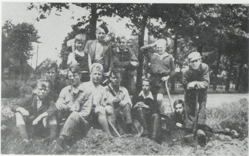
Een groep jongens van de school, opgepakt door de Duitsers in 1944, om graafwerkzaamheden te verrichten voor de O.T. (Organisation Todt).

In mei 1945 kwam eindelijk een eind aan de jaren van beproeving. Overal in het land werd aan de wederopbouw begonnen en het onderwijs hervat. In het begin ging dit met nogal wat moeilijkheden gepaard, want leerboeken waren of door de Duitsers als brandstof gebruikt of vernield. Ook veel schoolmeubilair was verdwenen of gehavend.