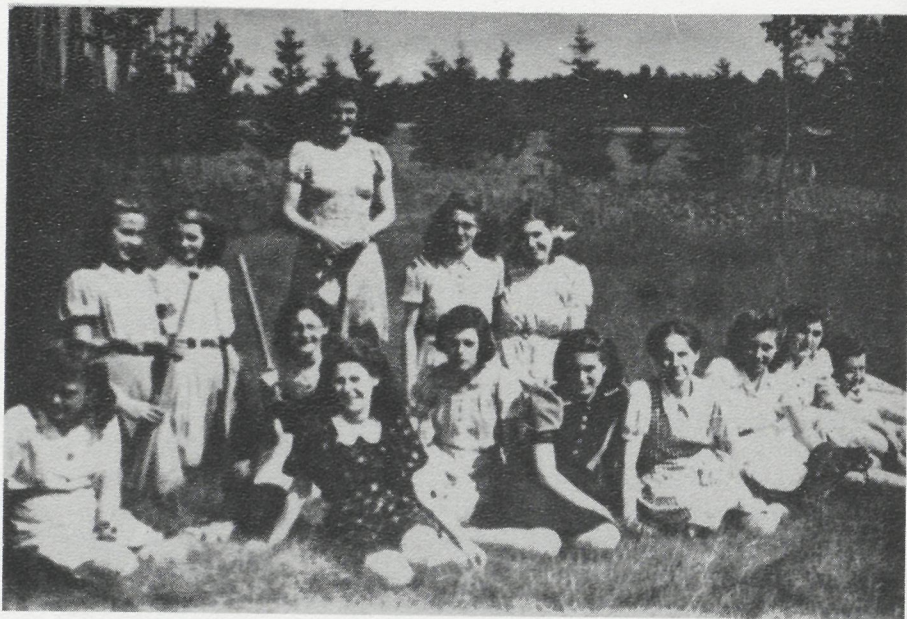
Een groep meisjes na de gymnastiekles op het Hoge land in 1942.

Per 1 sept. 1943 trad de heer A. Vermeer, die sinds 1935 onderwijzer aan de Wis-selse school was, in functie aan de ulo-school.