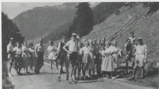
Schoolreis naar Zwitserland in 1949.

Om deze reis voor 46 leerlingen mogelijk te maken (de kosten per persoon bedroegen f 70.-, alles inbegrepen), hadden de leerlingen door het verrichten van allerlei karweitjes het grootste deel van de kosten zelf verdiend. De rest van het benodigde geld werd bijeengebracht door het houden van een bazar. De reis werd een groot succes. Maar de autoriteiten stonden er nog onwennig tegenover. De Inspecteur van het onderwijs keurde deze onderneming in de strengste bewoordingen af en op zijn verzoek, verbood het gemeentebestuur het hoofd der school in het vervolg buitenlandse schoolreizen te organiseren. Opmerkelijk was, dat nog in hetzelfde jaar aan de scholen voor voortgezet onderwijs in den lande een circulaire werd toegestuurd door het departement van onderwijs, waarin het maken van buitenlandse schoolreizen werd aanbevolen, mede om daardoor beter onderling begrip en waardering tussen de jeugd uit verschillende landen te bevorderen.