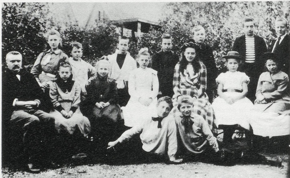
Schoolfoto Vaassense Mulo 1902 of 1903.

stellen dat hier het hele leerlingenbestand vereeuwigd is.