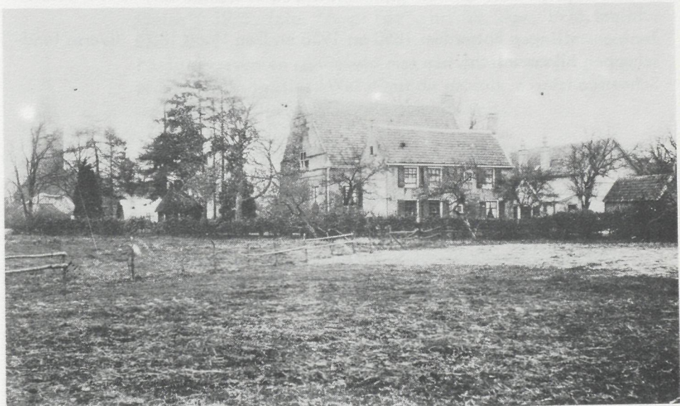
Foto van de verbouwde pastorie met het voorhuis. Rechts daarvan het schoolgebouw, ± 1900.

Het nieuwe schoolgebouw bevatte, "behalve een ruime vestibule, een tweetal flinke lokalen, volgens de eischen der wet ingericht". Het bouwen van de school was gegund aan de laagste inschrijver, H.J. van Dragt te Epe, voor f.4325,--.